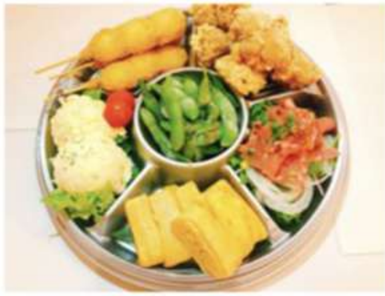
オードブル (6品盛+やきとり12本) 3980円(税込)