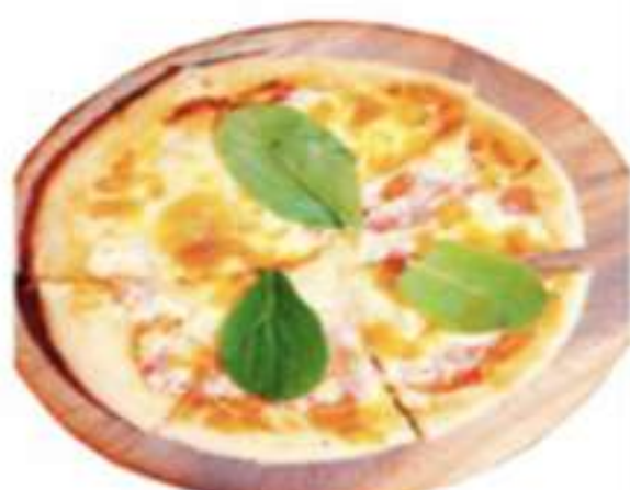
生ハムとトマトピザ 700円