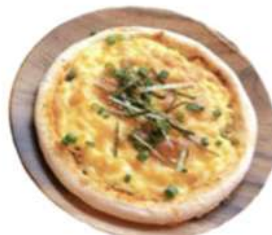
明太ポテトピザ 700円