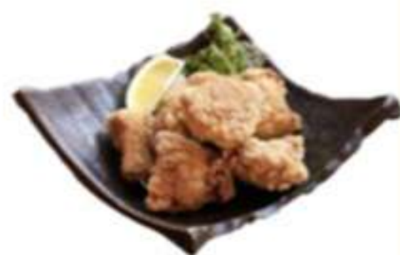
とりのからあげ 中 600円 小 400円 大 1200円