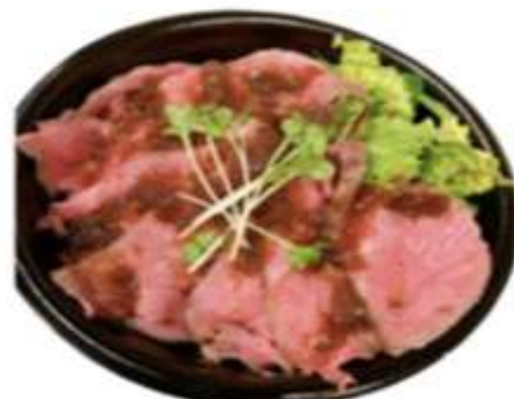
ローストビーフ丼S 950円

ランチも講評です! 店内飲食は、10%頂戴いたします。 前日までのご相談でランチの宅配も可能です。 5ヶ以上〜