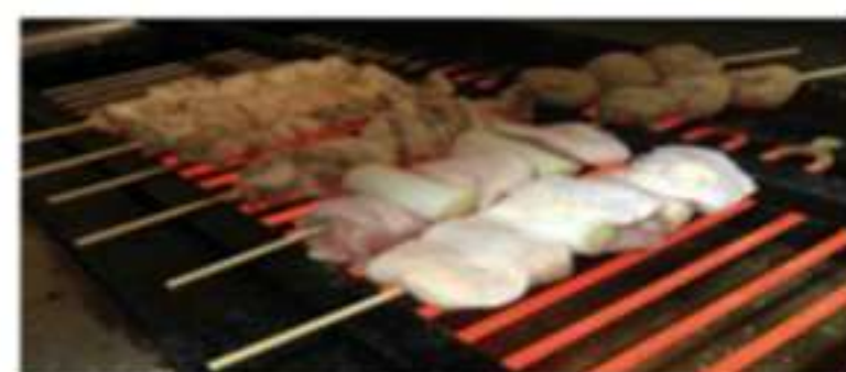
やきとり盛り合わせ(税込) 5本 540円 10本 1080円 15本 1620円 20本 2160円 各種単品は110円 ボンジリ、せせり、手羽先 165円