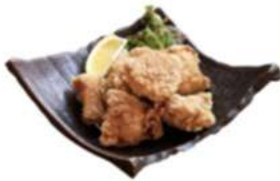
とりのからあげ 中 600円 小 400円 大 1200円