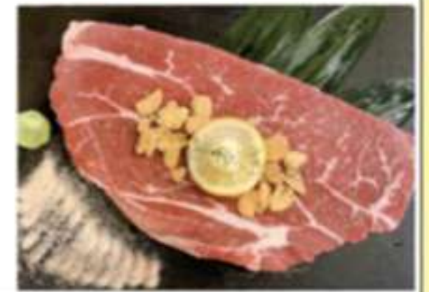
肩ロースステーキ 400グラム 2500円