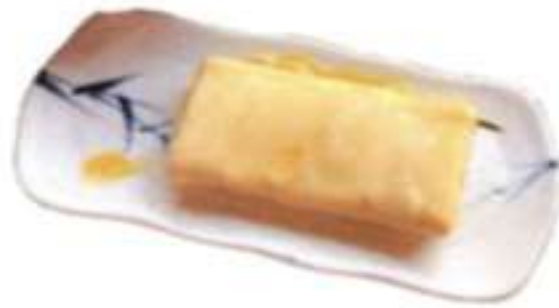
あつやき玉子 (ねぎ、納豆) 400円