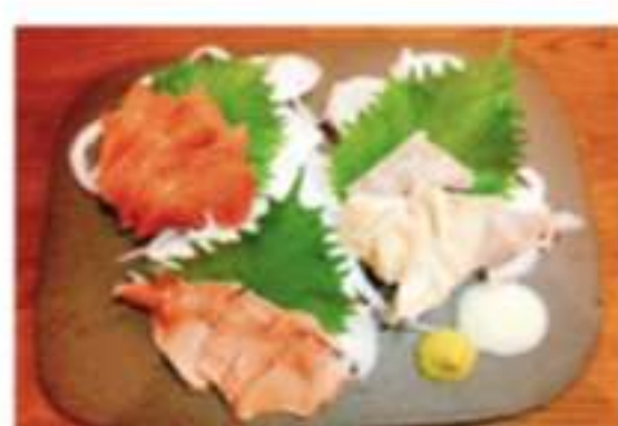
タン刺し、ハツ刺し、ガ ツ刺しの3点盛り 1000円