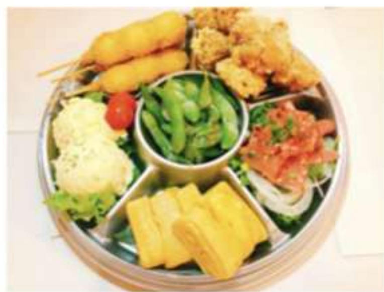
オードブル (6品盛+やきとり12本) 3980円(税込)