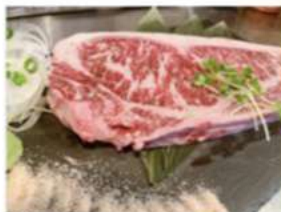
国産牛 サーロインステーキ 400グラム 6000円