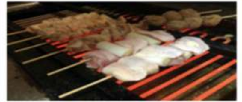
やきとり盛り合わせ(税込) 5本 540円 10本 1080円 15本 1620円 20本 2160円 各種単品は110円 ボンジリ、せせり、手羽先 165円