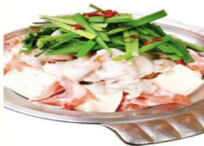
そのまま火にかけるだけ!! もつ鍋セット 3人前 2000円(税込)