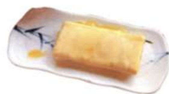
あつやき玉子 (ねぎ、納豆) 400円