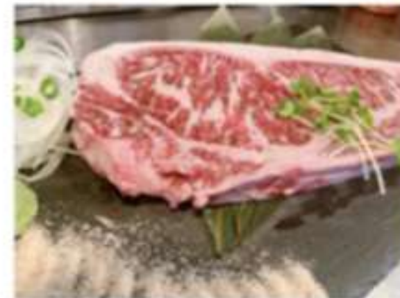
国産牛 サーロインステーキ 400グラム 6000円