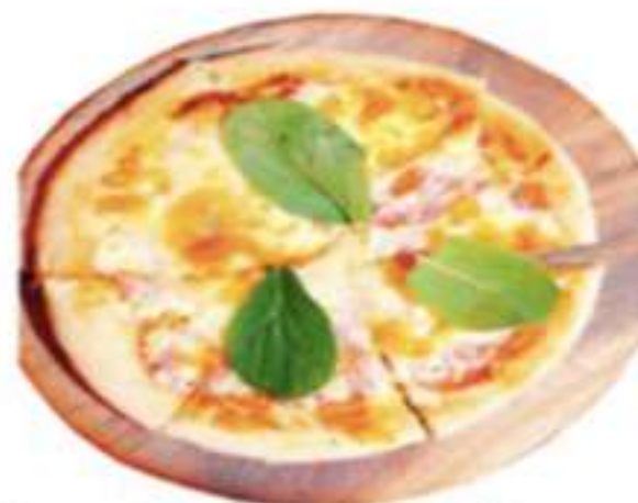
生ハムとトマトピザ 700円

【揚げ物】 アジフライ うずら卵フライ3本 カキフライ ポテトフライ 揚げたこ焼き 厚切りハムカツ 各400円 ジャガバター 300円 牛すじ煮込 500円